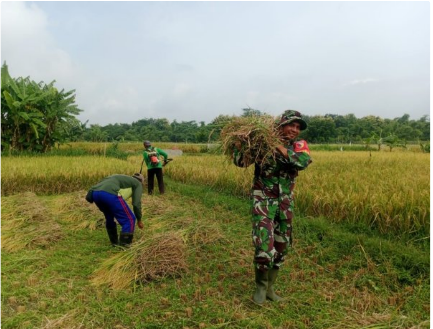
Dukung Program Ketahanan Pangan, Babinsa Koramil Bendo Dampingi Petani Panen Padi

Magetan. - Dalam upaya mendukung program ketahanan pangan nasional, Bintara Pembina Desa (Babinsa) Koramil 0804/13 Bendo jajaran Kodim